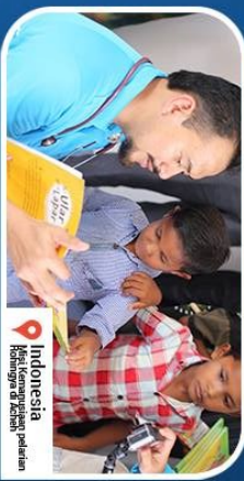
Indonesia Kegiatan Pengedaran Pelantikan